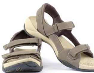
Skiftesko (evt. sandaler)