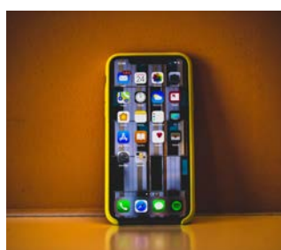
Mobiltelefon og oplader