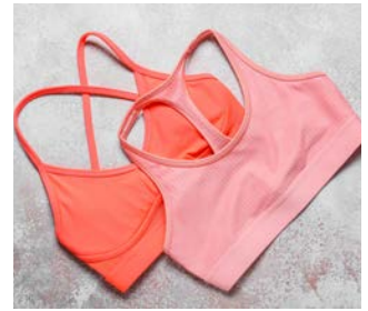
Bh/top til pigerne