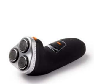
Barbermaskine eller skrabere