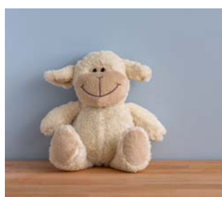
Andet som er vigtigt for dig