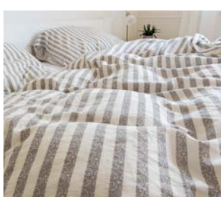
Dyne og pude med betræk eller en sovepose

Skal du være afsted i 2 uger på Sommerhøjskolen, så husk ekstra tøj