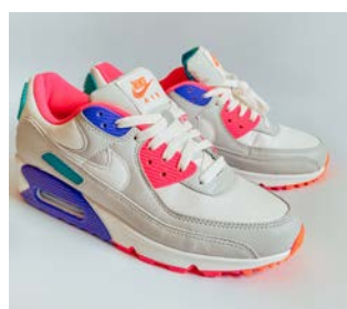
Sportstøj og kondisko