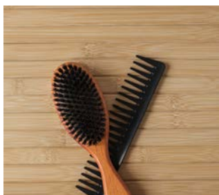
Kam eller børste